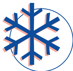
Kälte- und Klima

Bitte senden Sie Ihre aussagefähigen Bewerbungsunterlagen per Post oder per E-Mail an: