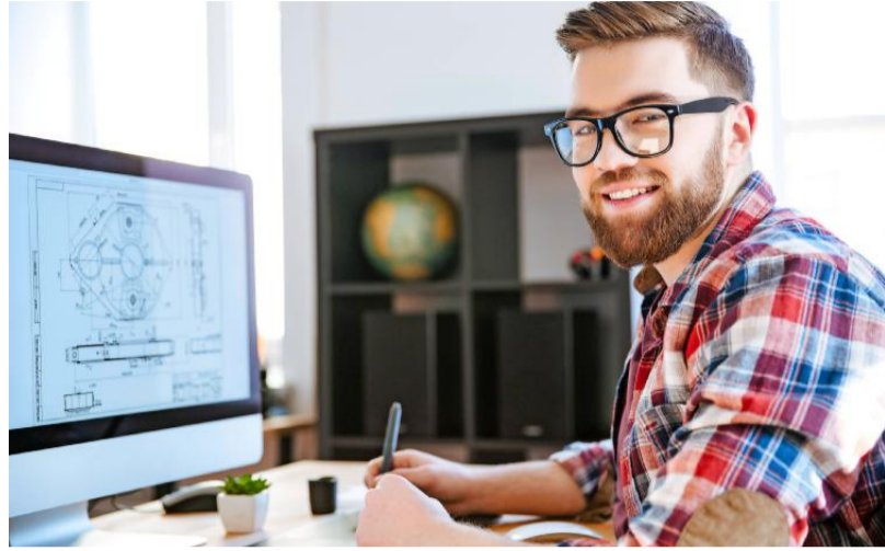
Ingenieure haben derzeit gut lachen: Sie sind auf dem Arbeitsmarkt gefragt wie nie. Unternehmen tun viel für ihre Fachkräftesicherung.

Gleichzeitig sei das Arbeitskräfteangebot auf einen neuen Tiefstand gesunken. Im Monatsdurchschnitt waren 30.390 Personen mit entsprechender Qualifikation arbeitslos. Die sehr hohe Nachfrage schlage