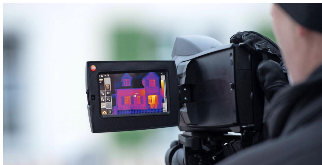
Wo ist die Schwachstelle? Zu den Aufgaben eines Energieberaters gehört es, Häuser zu begutachten, um herauszufinden, wo die Wärme verloren geht – und was dagegen zu tun ist.

➤ Mehr Informationen www.willkommen-im-kreis.hn