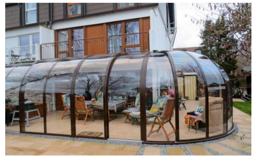
Die Elemente der Saphir Solar Veranda können an warmen Tagen geöffnet werden. Im Winter sorgen sie geschlossen für angenehme Temperaturen.

Vöroka Überdachungen individuell und auf Maß nach Kundenwunsch